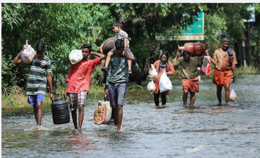
Útek pre vodu

identifikovať takéto rodiny. Financie zozbierané v Tehličke budú súčasťou väčšieho projektu podpory, ktorý už prebieha.