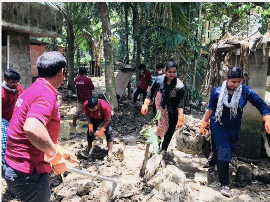
Čistenie domov po záplavách